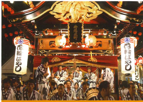
ユネスコ無形文化遺産登録