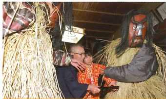
ユネスコ無形文化遺産登録