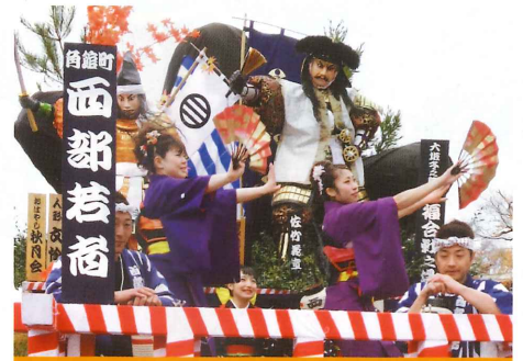
ユネスコ無形文化遺産登録