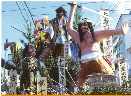
ユネスコ無形文化遺産登録