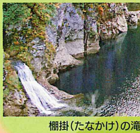
棚掛(たなかけ)の滝