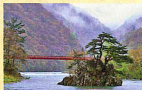
巫女石:増水のため、川を渡れずにいる巫女を明神様が救ったという伝説の岩。