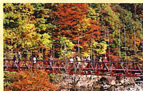
神の岩橋:溪谷入口に架かる全長80mの吊り橋。大正15年にできた森林軌道で、県内で最も古い歴史の吊り橋。