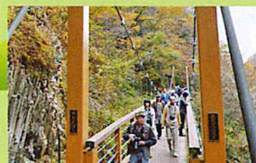
誓願橋:崩落によって失われた散策道に架けられた新しい吊り橋。