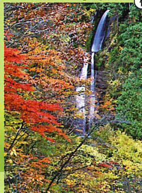
回顧(みかえり)の滝:何度も振り返ってみたいくなるほど美しい、溪谷一番の名所の滝。