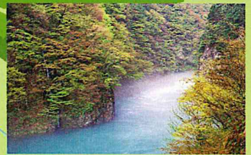
溪谷展望台付近:回顧の滝から少し奥へ進んだ場所にもある展望スポット。