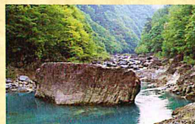
莫産の石:急流を押し留めるような巨岩の上面は、ゴザを数枚敷けるほど平らになっている。