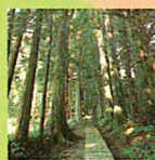
金峰神社:参道には樹齢350～800年以上の老杉が並び、仁王門には杉の巨木一本で彫刻された仁王像が安置されている。