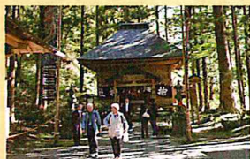
抱返神社:抱返り溪谷の入口にある老杉で囲まれた神社。荘厳な雰囲気がある。