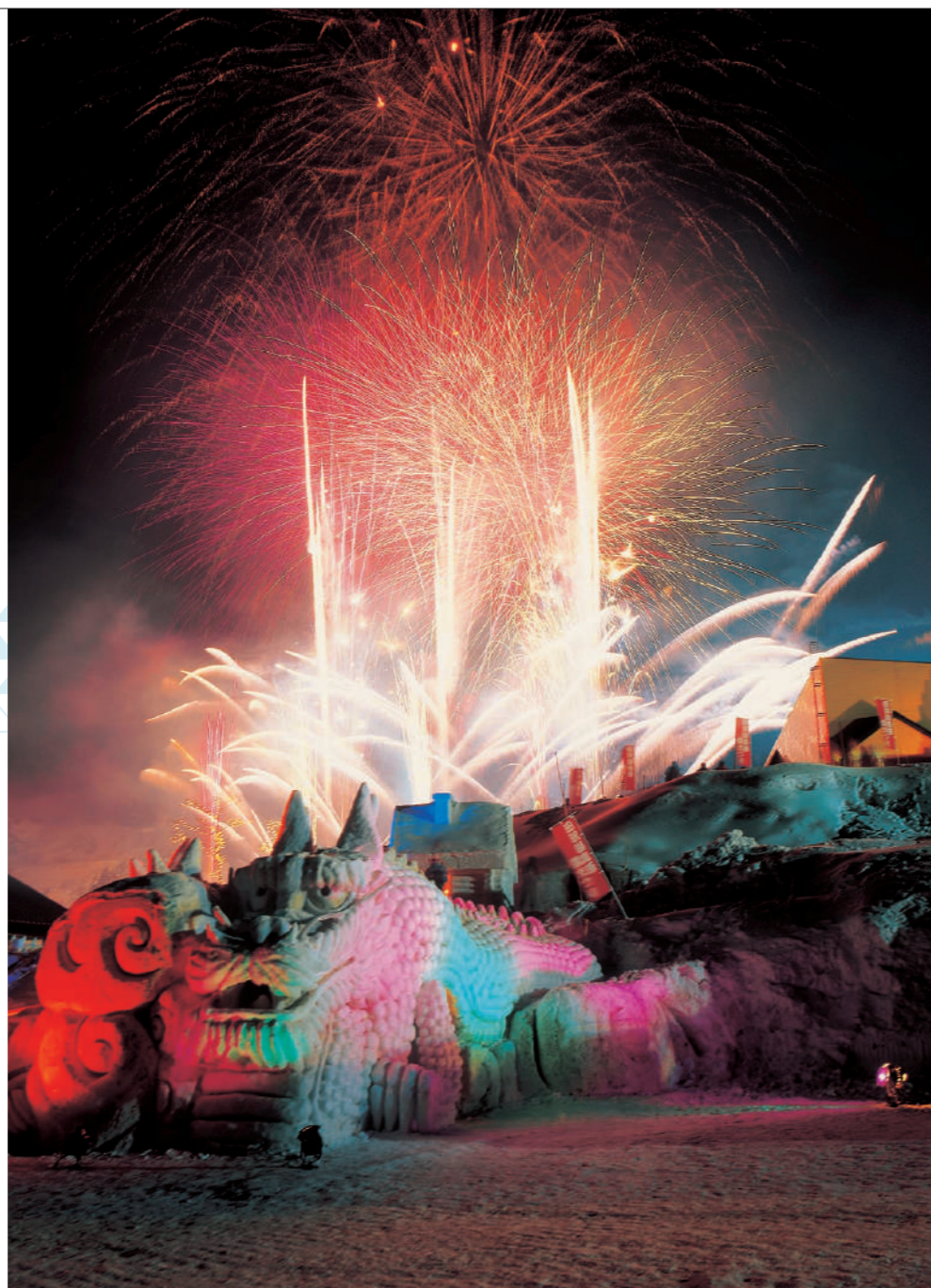
田沢湖高原雪まつり 花火

日本一深い湖、田沢湖。夏は観光客でにぎわうが、冬は夏とは違い空気が清々しい。「第49回田沢湖高原雪まつり」は仙北市のイベントが一堂に会して開催される。伝統行事の「上桧木内の紙風船上げ」や「火振りかまくら」を体験することができる。クライマックスを飾る白銀の世界に打ち上る花火も美しい。