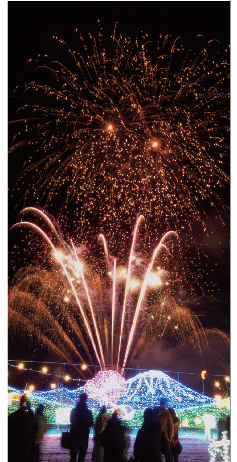
小岩井ウィンターイルミネーション 花火

園雫石スキー場 雫石プリンスホテル 岩手県雫石町高倉温泉 ☎019-693-1111 図車：東北自動車道盛岡ICより約30分