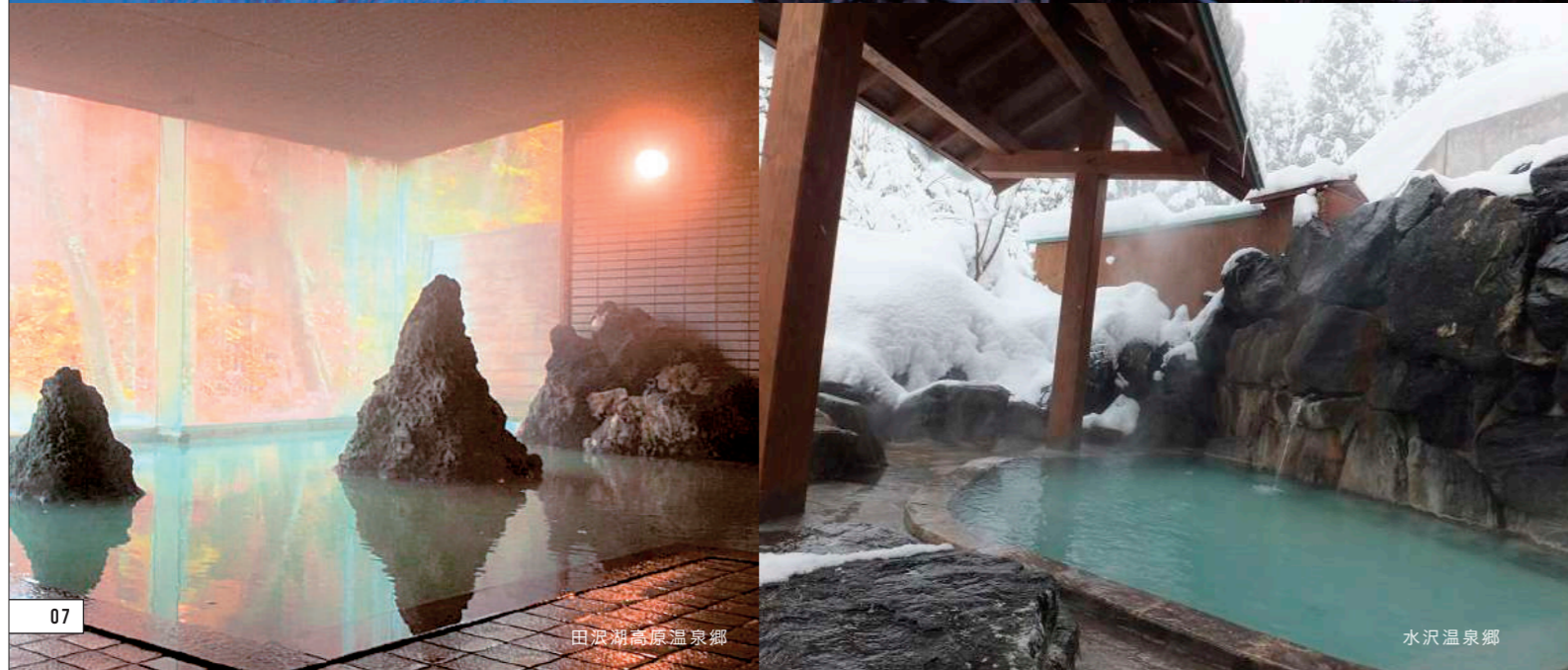
田沢湖高原温泉郷