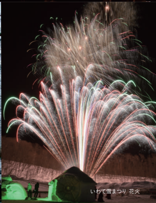
いわて雪まつり 花火