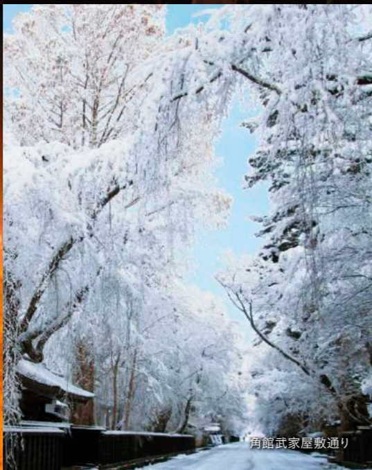
角館武家屋敷通り