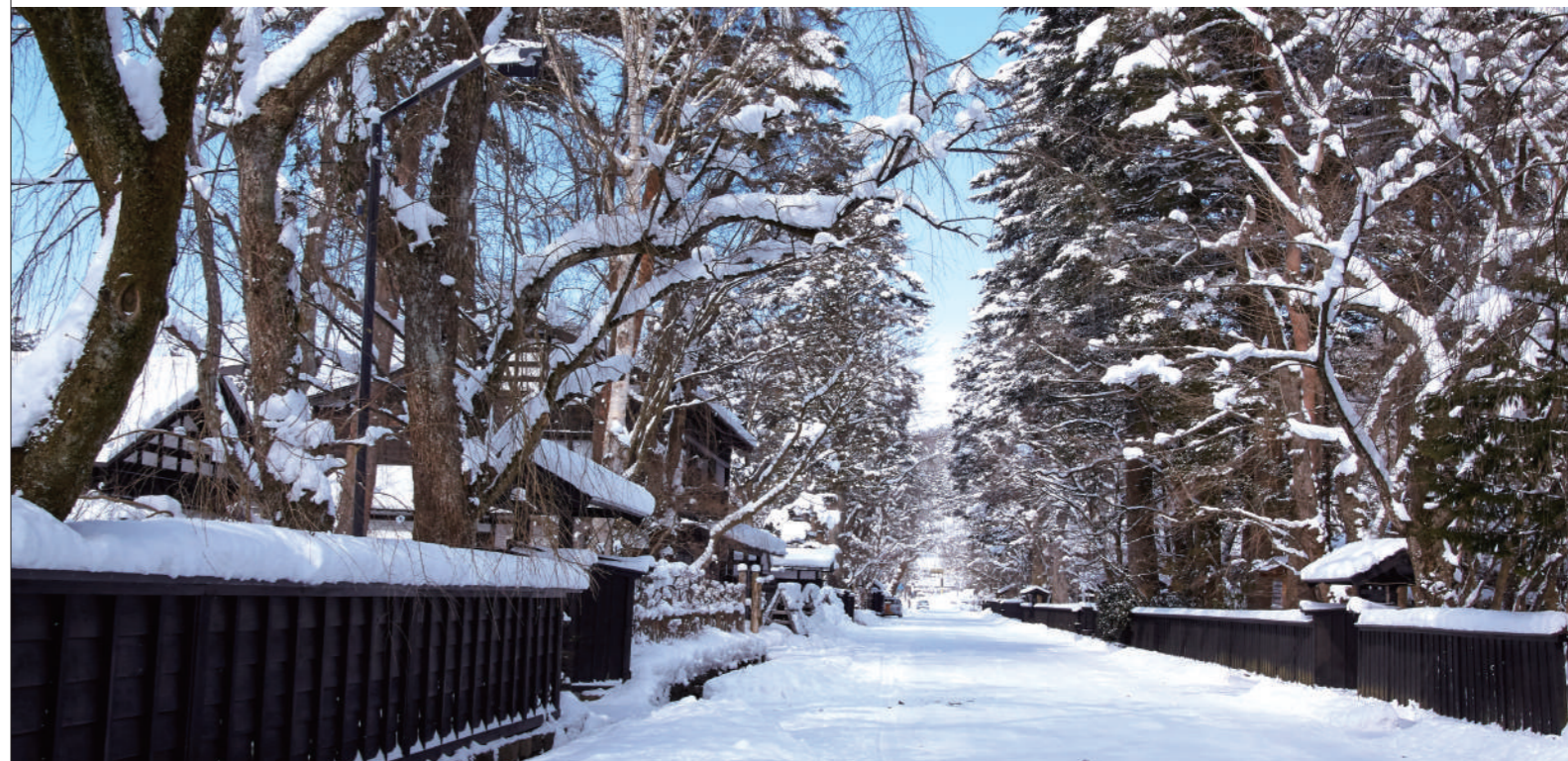
角館武家屋敷通り

みちのくの小京都「角館」では、冬場に歴史を感じられる催しが多数開催される。囲炉裏を囲んで角館の歴史や暮らしを案内人が語る「角館冬がたり」、無病息災や五穀豊穡を願い火をつけた炭俵を振り回す「火振りかまくら」「角館雑めくり」などが開催されるほか、西木地区では巨大な紙風船が冬の夜空を彩る「上桧木内の紙風船上げ」が開催される。