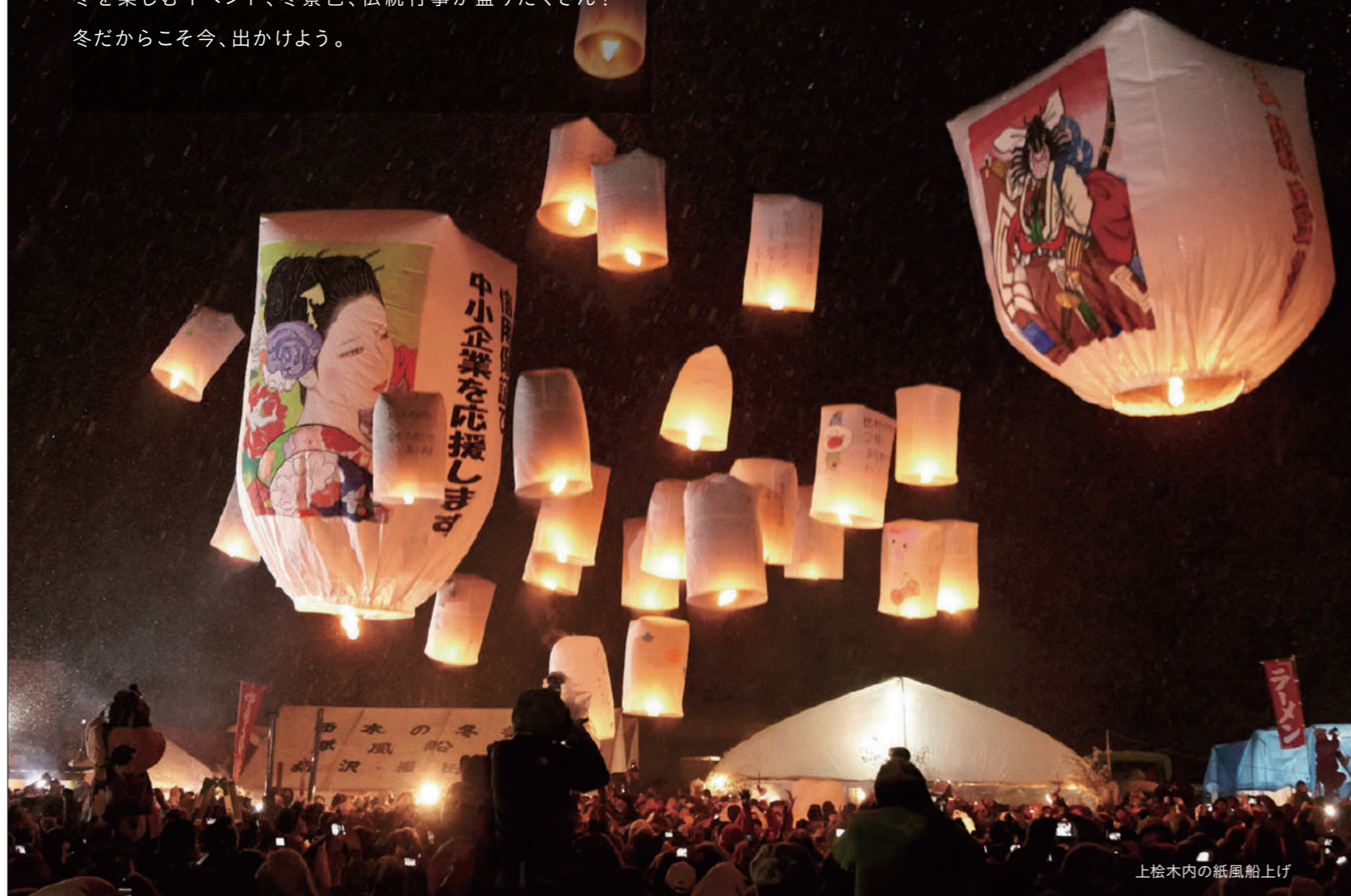
上絵木内の紙風船上げ

冬は深い雪に囲まれる雫石・田沢湖・角館エリア。そんな冬を楽しむイベント、冬景色、伝統行事が盛りだくさん！冬だからこそ今、出かけよう。