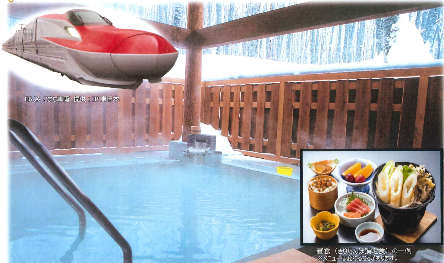
E6系 こまち車両