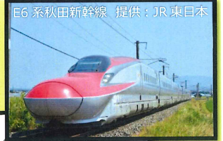
E6系秋田新幹線