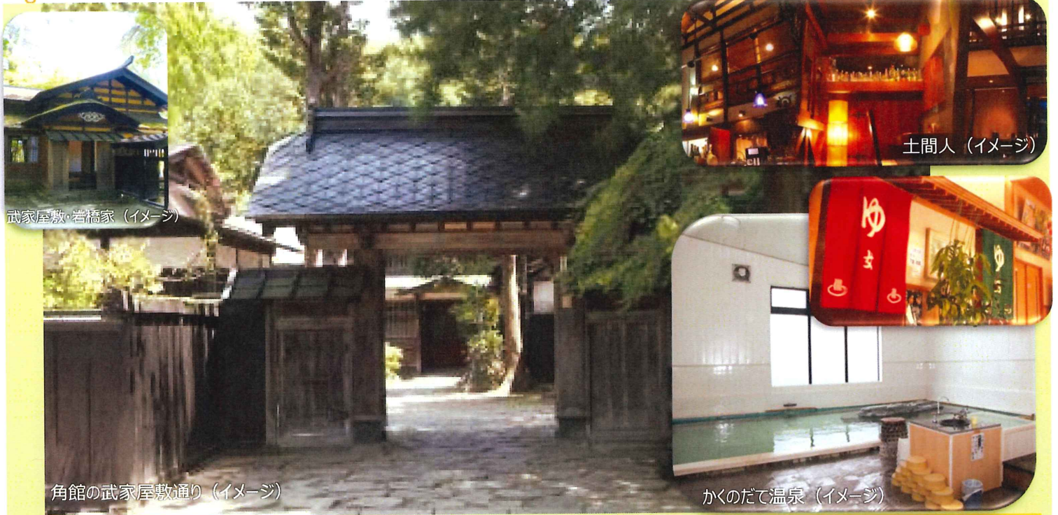
武家屋敷・岩橋家 (イメージ)