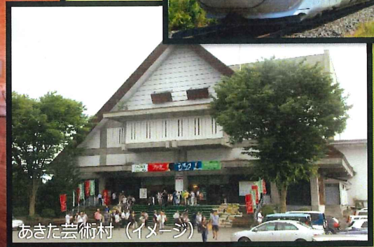
あきた芸術村 (イメージ)