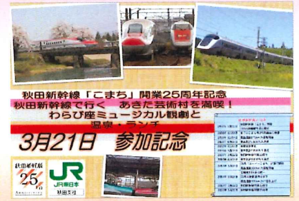
秋田新幹線「こまち」開業25周年記念 秋田新幹線で行く あきた芸術村を満喫! わらび座ミュージカル観劇と 温泉・ランチ