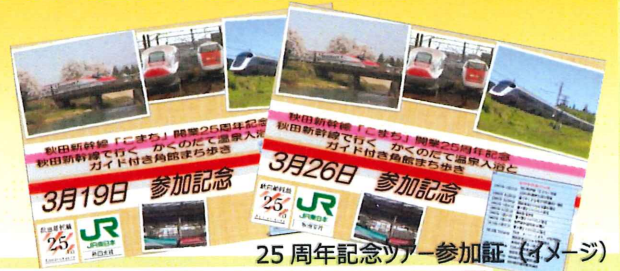
25 周年記念ツアー参加証 (イメージ)