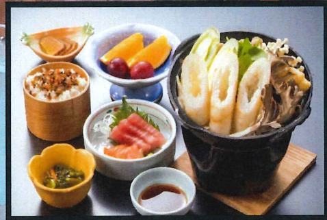
昼食（きりたんぼ鍋定食）の一例 ※メニューは変わることがあります。