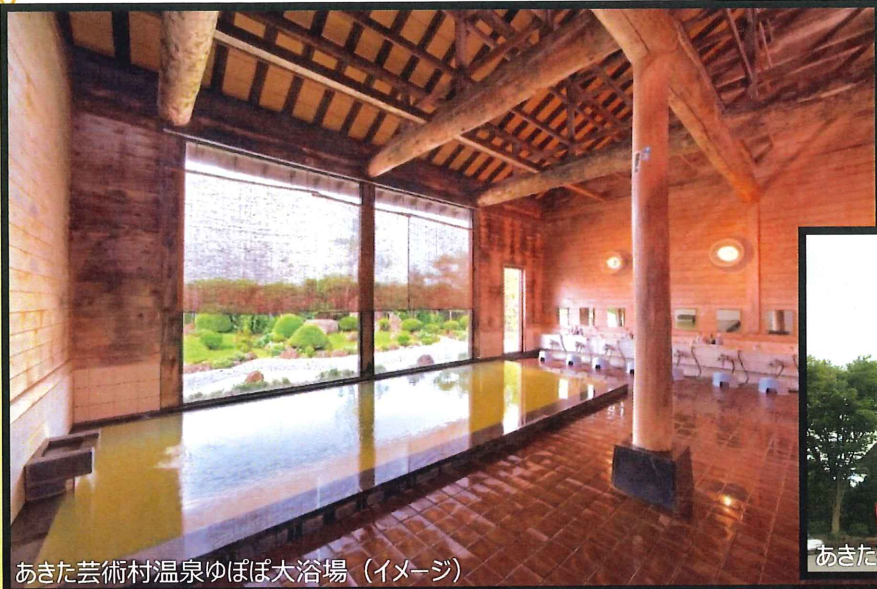
あきた芸術村温泉ゆぼぼ大浴場 (イメージ)