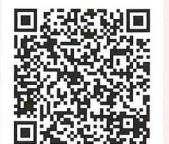
冬の角館で女子旅