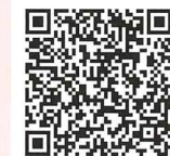
夏の角館でワーケーション