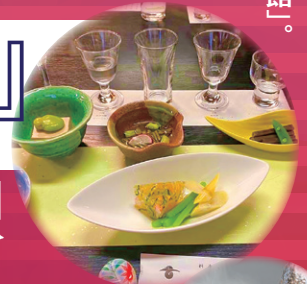
ペアリング料理 (一例)