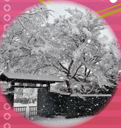
角館武家屋敷通り

「みちのくの小京都」と呼ばれ 歴史ある日本らしい街並みが今も残る「角館」。 冬の角館の魅力を体験していただくため 角館駅前から武家屋敷を散策しながら 秋田の冬酒やお茶を楽しめる試飲や 料亭「登喜和」で 秋田の冬酒イベントを開催します。