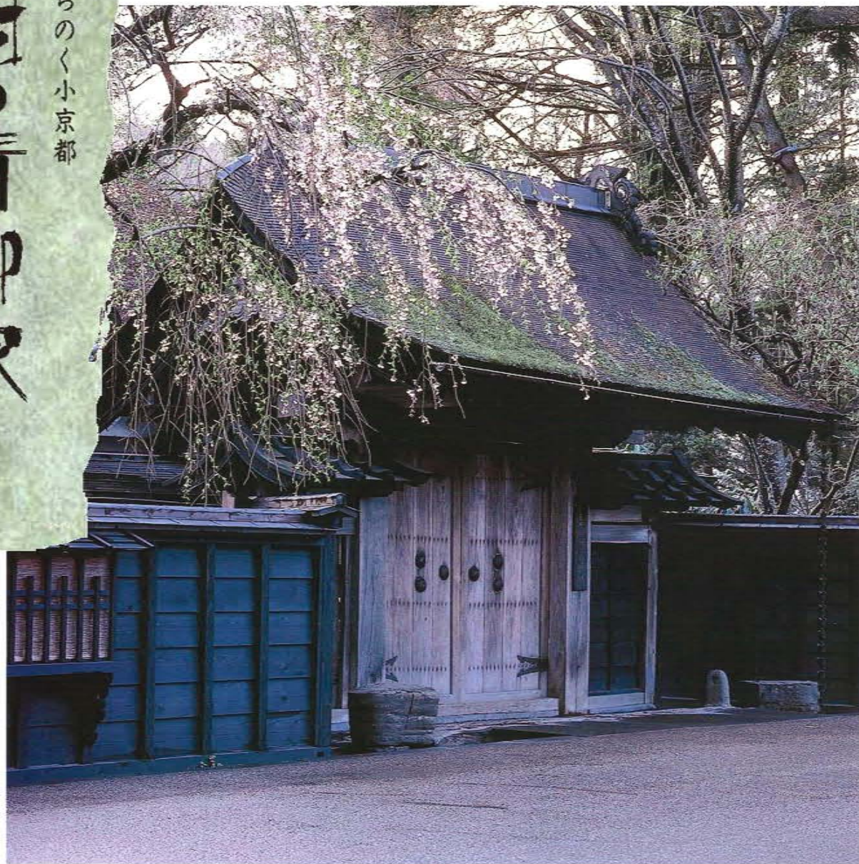
国選定重要伝統的建造物群 秋田県指定史跡 秋田県文化財