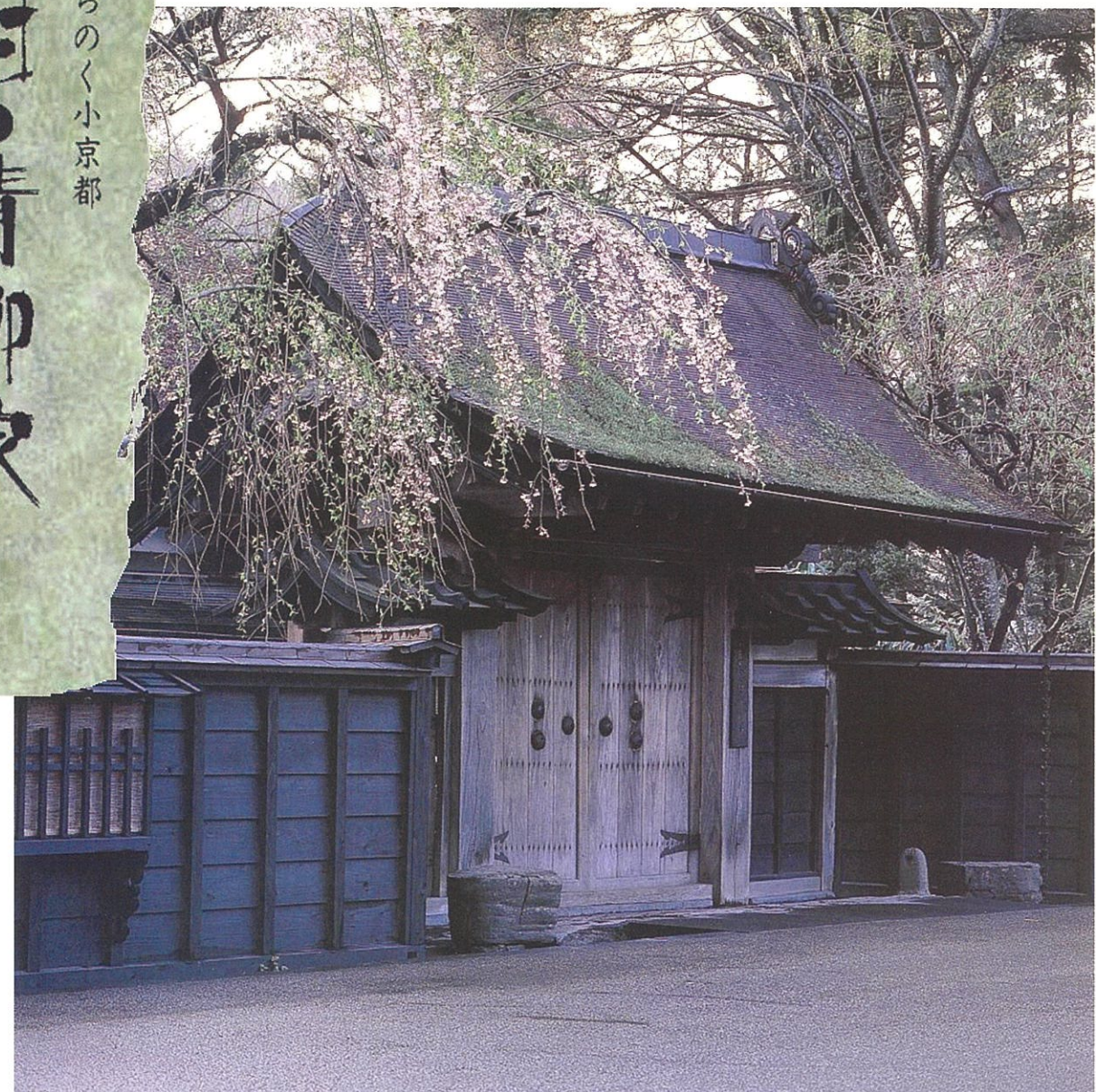
国選定重要伝統的建造物群 秋田県指定史跡 秋田県文化財