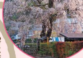
●ガーデン ●グラントール

発電自転車で敷地内の1本の桜の木をライトアップ。 参加いただいた方に、サキホコレ300g(先着20組)をプレゼント! (協賛:東北電力(株)、(株)ユアテック)