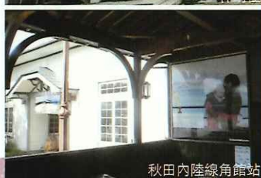
秋田內陸線角館站