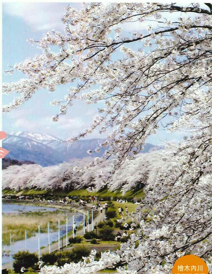
檜木內川 堤岸的景致